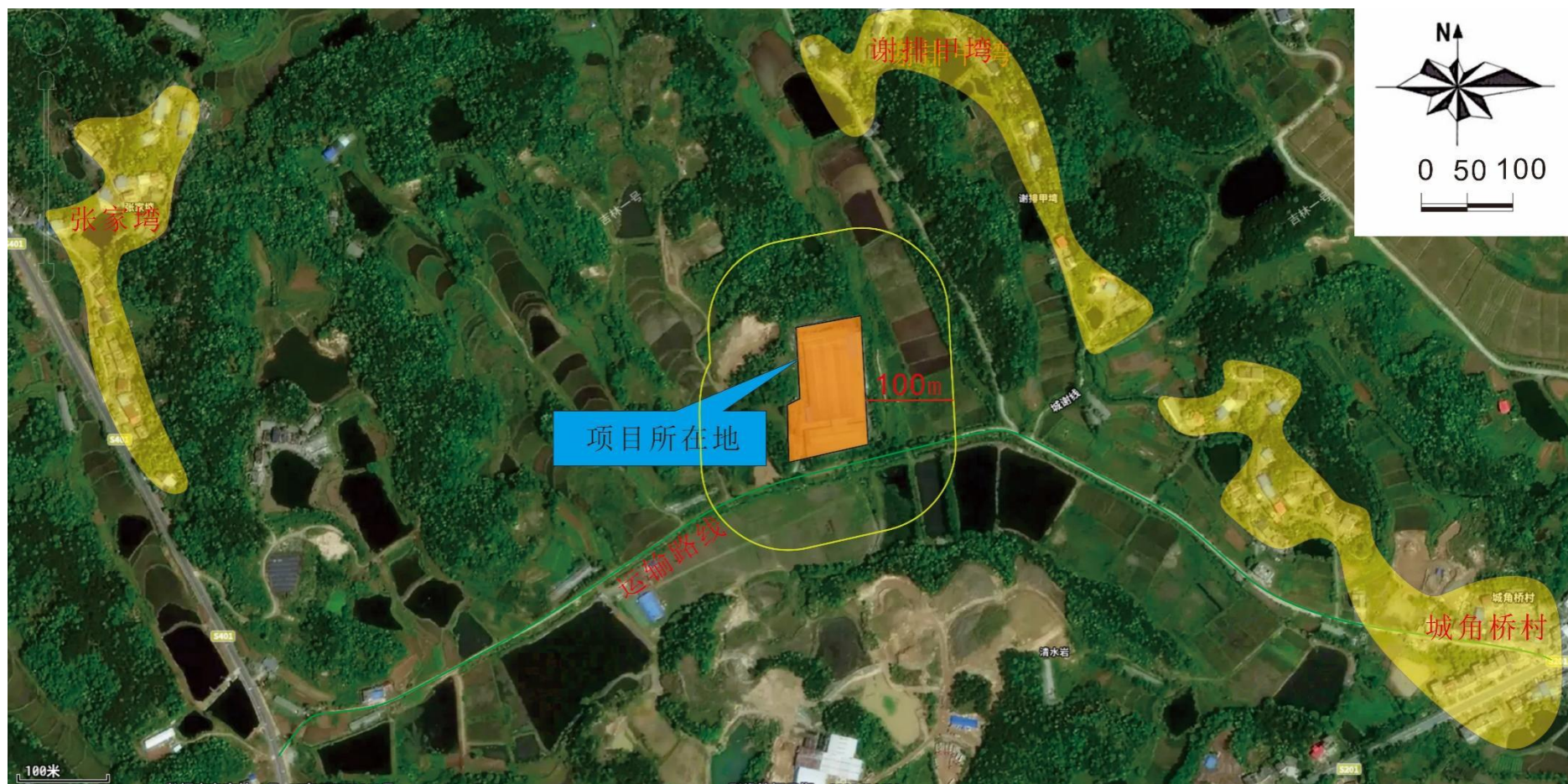
附图 4 项目卫生防护距离包络线图