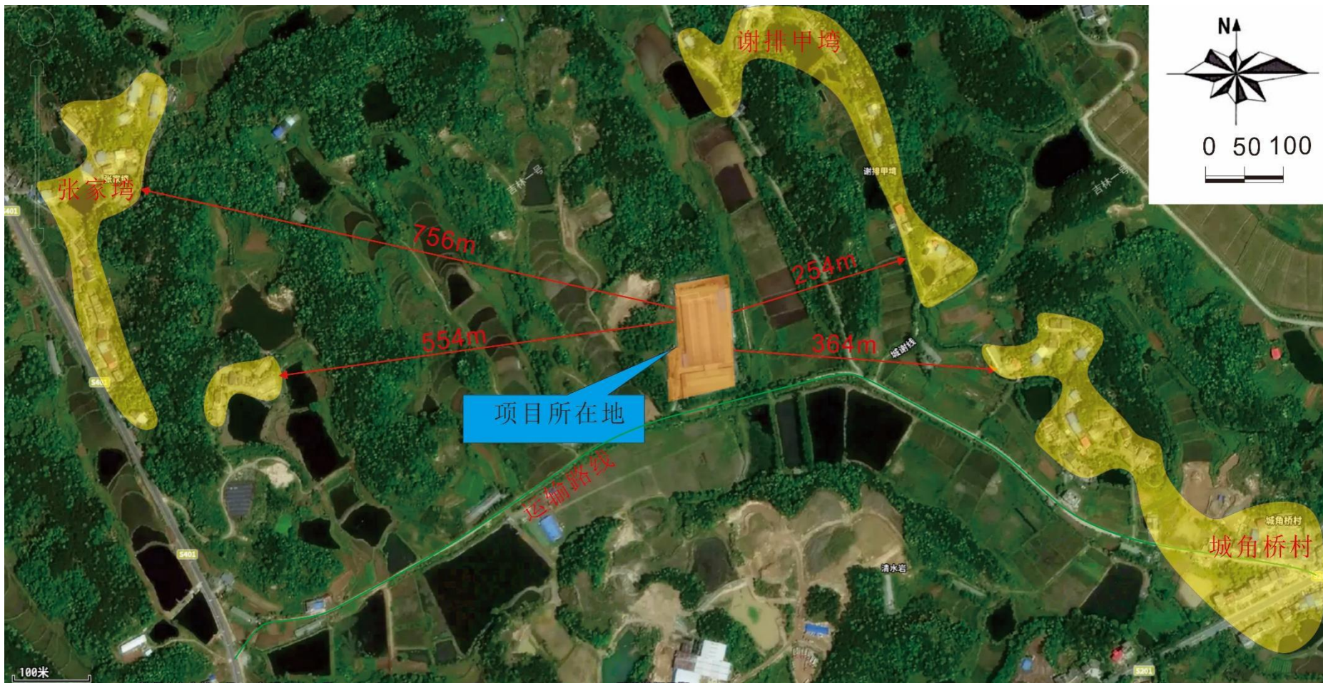
附图2 项目周边关系分布图