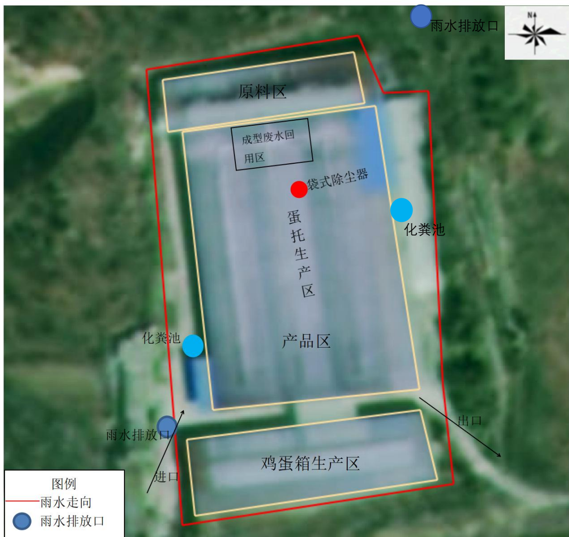
附图3 项目总平面图布局图